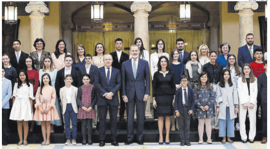
Foto de familia de los participantes en la iniciativa '¿Qué es un rey para ti?', con estudiantes llegados de toda España.